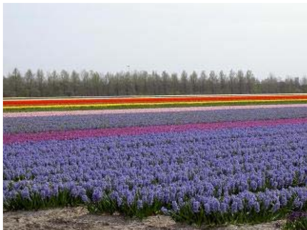
Hyacinten op de Zanderij in Hillegom