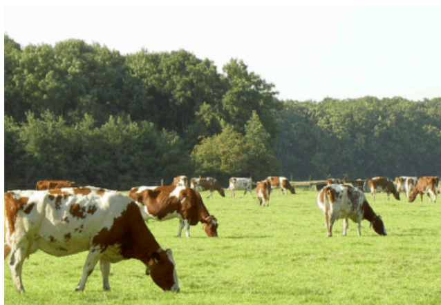
In hoeverre bieden de graslanden in de Bollenstreek nog compensatiemogelijkheden voor bollenteelt? Dat wordt dit najaar nader onderzocht.

Deze onderzoeken lopen parallel met de 'ontwerpateliers' die de regio Holland Rijnland dit najaar organiseert. Daarbij wordt met deskundigen uit de sectoren gesproken over de knelpunten en oplossingen op het gebied van de bollenteelt, de glastuinbouw, de veehouderij en de agrarische handels- en exportbedrijven. Aan de onderzoeken wordt meegewerkt door nagenoeg alle overheden en organisaties die actief zijn in de regio.